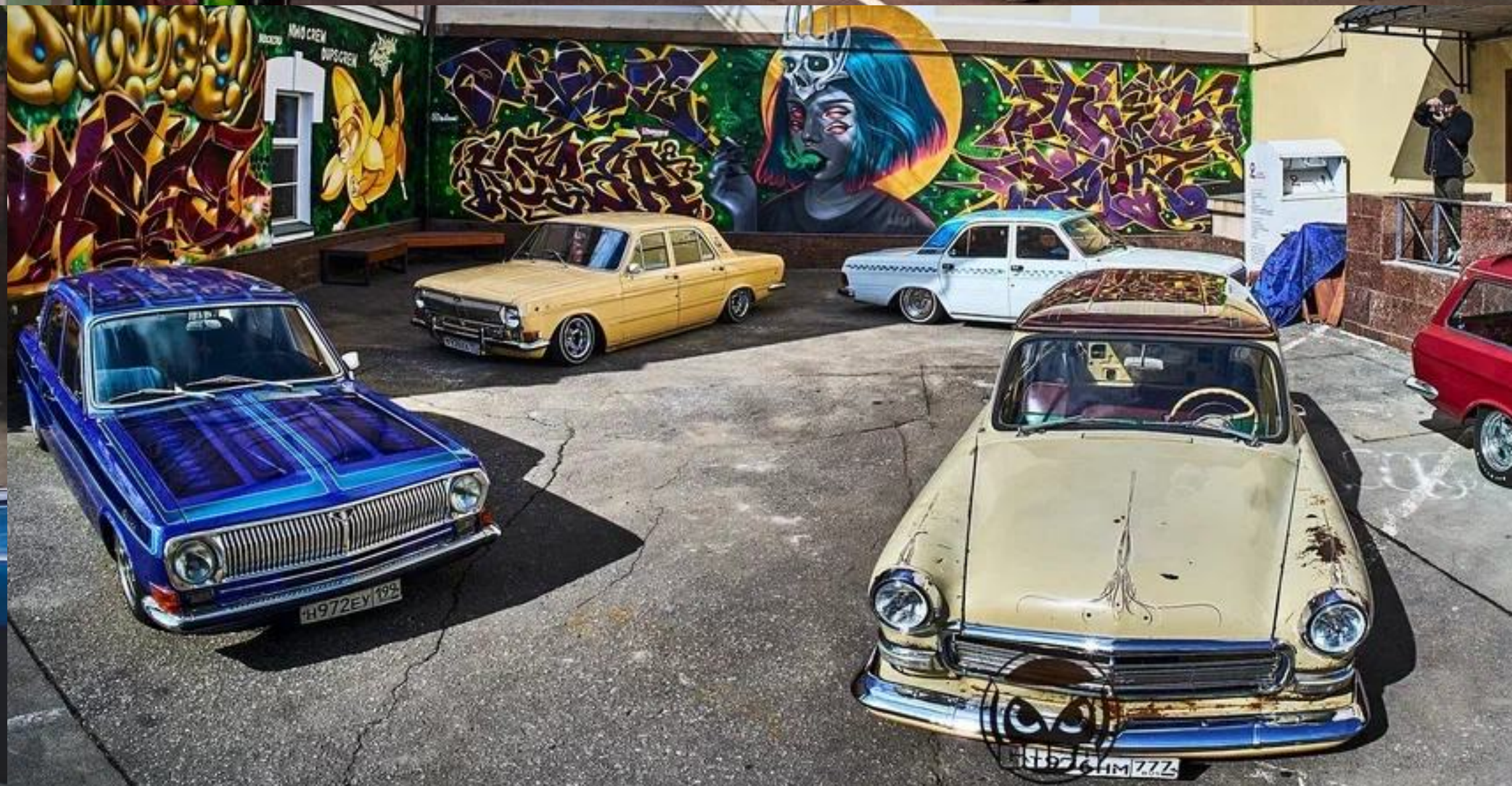
ВНУТРЕННИЙ ДВОР - НОВЫЙ КРЕАТИВНЫЙ КЛАСТЕР В БАСМАННОМ РАЙОНЕ МОСКВЫ ВПЕЧАТЛЯЕТ СВОИМ ПРОСТОРОМ